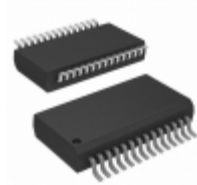
MCP23017T-E/SS Micrel / Microchip Technology IC I/O EXPANDER 16BIT I2C 28SSOP