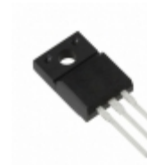
BA17812T Rohm Semiconductor IC REG LDO 12V 1A TO220FP