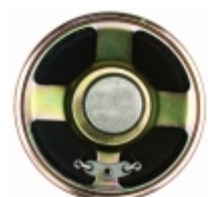
GA0701 CUI Inc. SPEAKER ALNICO 80HM .5W 70MM RND