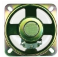
GA0666M CUI Inc. SPEAKER ALNICO 80HM .5W 66MM SQR