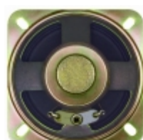
GA0666 CUI Inc. SPEAKER ALNICO 80HM .5W 66MM SQR