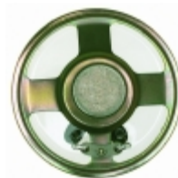
GA0771M CUI Inc. SPEAKER ALNICO 80HM 1W 77MM RND