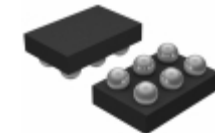
ADP2138ACBZ-3.3-R7 Analog Devices Inc. IC REG BCK 3.3V 0.8A SYNC 6WLCSP