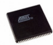
AT94K10AL-25AJC Microchip Technology IC FPSLIC 10K GATE 25MHZ 84PLCC