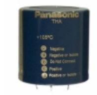
ECE-T1VA223EA Panasonic Electronic Components CAP ALUM 22000UF 20% 35V SNAP