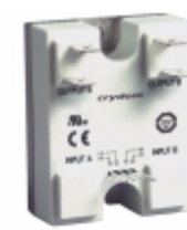
84140210 Crydom Co. SSR GN2 DUAL 40A/240VAC 17-32VDC