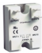
84140200 Crydom Co. SSR GN2 DUAL 40A/240VAC 4-15VDC