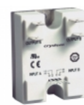
84140310 Crydom Co. SSR GN2 DUAL 40A/240VAC 17-32VDC