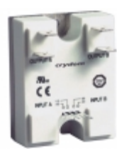
84140500 Crydom Co. SSR GN2 DUAL 25A/480VAC 4-15VDC