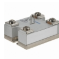
84140213 Crydom Co. RELAY DUAL 40A 240V ZC 17-32VDC