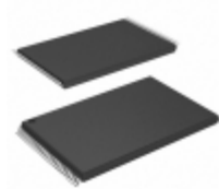
SST38VF6404-90-5C-EKE Microchip Technology IC FLASH 64MBIT 90NS 48TSOP