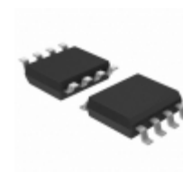
ATTINY412-SSFR Micrel / Microchip Technology 20MHZ, 4KB, SOIC8, IND 125C, GRE