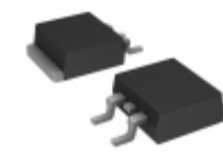
VS-16CTQ080SHM3 Electro-Films (EFI) / Vishay DIODE SCHOTTKY 80V 8A D2PAK