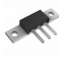
85CNQ015 SMC Diode Solutions DIODE SCHOTTKY 15V 40A PRM2