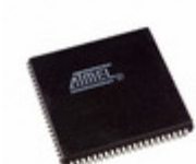
AT40K05-2AJI Microchip Technology IC FPGA 62 I/O 84PLCC