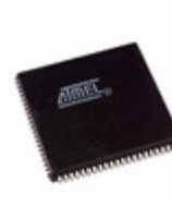
AT40K05-2AJC Microchip Technology IC FPGA 62 I/O 84PLCC