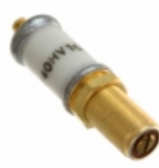
AT40HV Knowles Voltronics CAP TRIMMER 1.5-40PF 1KV PNL MNT