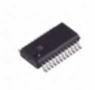
ADA4411-3ARQZ Analog Devices Inc. IC HD/FILTER/BUFFER/MUX 24QSOP