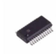
ADA4411-3ARQZ-R7 Analog Devices Inc. IC HD/FILTER/BUFFER/MUX 24QSOP