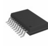
ADA4412-3ARQZ-RL Analog Devices Inc. IC FILTER VID RGB/HD/SD 20QSOP