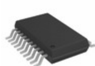
ADA4412-3ARQZ Analog Devices Inc. IC FILTER VID RGB/HD/SD 20-QSOP