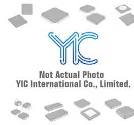
DTA143TET1 ON DTA143TET1 ON