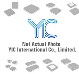
DTA143TE TL ROHM DTA143TE TL ROHM