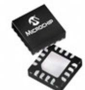
PIC16F506-I/MG Microchip Technology IC MCU 8BIT 1.5KB FLASH 16QFN