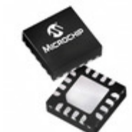
PIC16F506T-I/MG Microchip Technology IC MCU 8BIT 1.5KB FLASH 16QFN