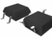
CPC1001N IXYS Integrated Circuits Division OPTOISOLATOR 1.5KV TRANS 4SMD