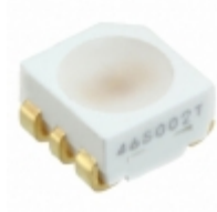
LNJ8L6C18RA Panasonic Electronic Components LED RED 6SMD