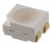
LNJ8L4C38RA Panasonic Electronic Components LED RED 4PLCC SMD