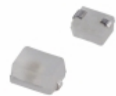
LNJ906W5BUX Panasonic Electronic Components LED BLUE DIFFUSED 0805 SMD