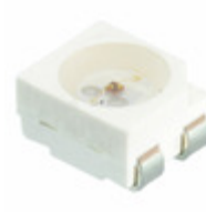
LNJ8L4C28RAA Panasonic Electronic Components LED RED CLEAR 4PLCC SMD