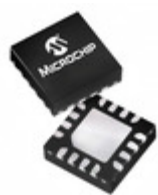
PIC16LF15324-E/JQ Microchip Technology IC MCU 8BIT 7KB FLASH 16UQFN