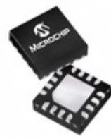
PIC16LF15324-I/JQ Microchip Technology IC MCU 8BIT 7KB FLASH 16UQFN