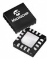
PIC16LF15324T-I/JQ Microchip Technology IC MCU 8BIT 7KB FLASH 16UQFN