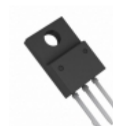
BA17818CP-E2 Rohm Semiconductor IC REG LDO 18V 1A TO220CP-3