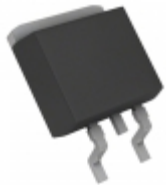
BA17820FP-E2 Rohm Semiconductor IC REG LDO 20V 1A TO252-3