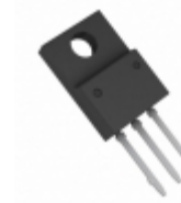
BA17824CP-E2 Rohm Semiconductor IC REG LDO 24V 1A TO220CP-3