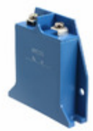
B60K385 EPCOS (TDK) VARISTOR 620V 70KA CHASSIS