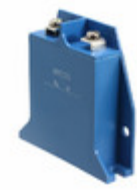
B60K130 EPCOS (TDK) VARISTOR 205V 70KA CHASSIS