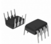
ACPL-827-060E Broadcom Limited OPTOISOLATOR 5KV 2CH TRANS 8DIP