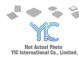
RT9166-12GXL RICHTEK RICHTEK SOT-89