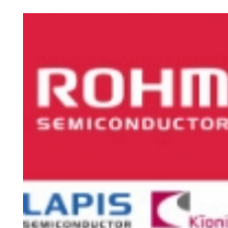
BD3818KS Rohm Semiconductor IC SOUND PROCESSOR 80SQFP