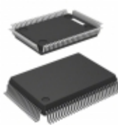
BD3817KS Rohm Semiconductor IC SOUND PROCESSOR 100SQFP