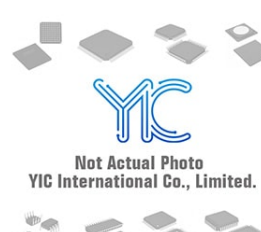
SI8712AC-B-IS. SILICON SI8712AC-B-IS. SILICON