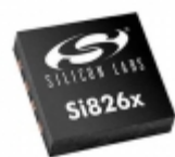
SI8712AD-B-IM Silicon Labs DGTL ISO 5KV 1CH GEN PURP 8LGA