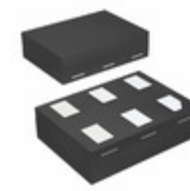
74LVCE1G08FZ4-7 Diodes Incorporated IC GATE AND 1CH 2-INP 6-DFN