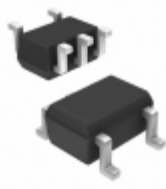
74LVCE1G07SE-7 Diodes Incorporated IC BUFF/DVR OP/DRAIN 1IN SOT353