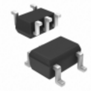
74LVCE1G08SE-7 Diodes Incorporated IC GATE AND 1CH 2-INP SOT-353