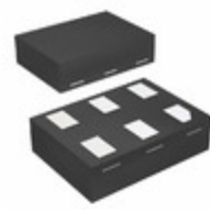
74LVCE1G125FZ4-7 Diodes Incorporated IC BUFF/BUS 3ST SGL DFN1410-6