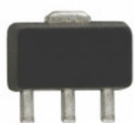
SXA-389B RFMD IC AMP HBT GAAS 1/4W SOT-89