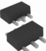
MCP1804T-2502I/MT Microchip Technology IC REG LDO 2.5V 0.1A SOT89-5