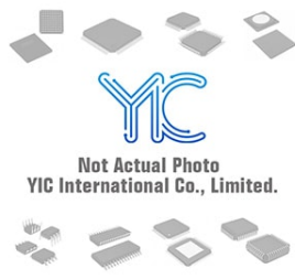
LT1032CSW. LT LT1032CSW. LT