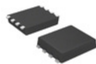
S-24C16DI-I8T1U5 SII Semiconductor Corporation IC EEPROM 16KBIT 1MHZ SNT8A