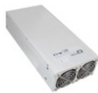
HDS1500PS48 XP Power AC/DC CONVERTER 48V 1500W