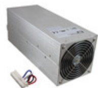
HDS3000PS12 XP Power AC/DC CONVERTER 12V 3000W