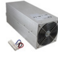
HDS3000PS24 XP Power AC/DC CONVERTER 24V 3000W