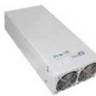
HDS1500PS36 XP Power AC/DC CONVERTER 36V 1500W