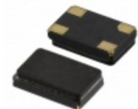
ABM3C-12.000MHZ-B-4-Y-T Abracon Corporation CRYSTAL 12.0000MHZ 18PF SMD