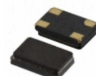
ABM3C-11.0592MHZ-D4Y-T Abracon Corporation CRYSTAL 11.0592MHZ 18PF SMD