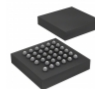
BU1852GXW-E2 Rohm Semiconductor IC GPIO KEY ENCODER 8X12 35-UBGA