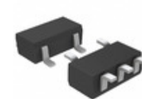
RB471ET148 Rohm Semiconductor DIODE ARRAY SCHOTTKY 40V SMD5