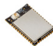
XB3-24DMUM-J Digi International RF TXRX MOD ZIGBEE BLE U.FL ANT