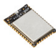
XB3-24Z8CM Digi International RF TXRX MOD ZIGBEE CHIP ANT