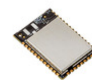
XB3-24DMRM-J Digi International RF TXRX MODULE ZIGBEE BLE