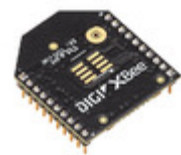
XB3-24Z8PT-J Digi International RF TXRX MOD ZIGBEE TRACE ANT