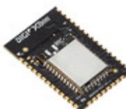
XB3-24Z8PS-J Digi International RF TXRX MOD ZIGBEE TRACE ANT