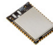
XB3-24Z8RM-J Digi International RF TXRX MOD ZIGBEE PAD ANT