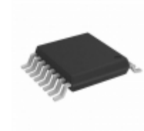
PL580-370C Microchip Technology IC VCXO 640MHZ 16TSSOP