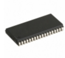
IS61WV2568EDBLL-10KLI-TR ISSI, Integrated Silicon Solution Inc IC SRAM 2MBIT 10NS 36 SOJ