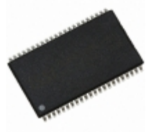
IS61WV2568EDBLL-10TLI-TR ISSI, Integrated Silicon Solution Inc IC SRAM 2MBIT 10NS 44TSOP