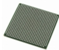
LFE2-35SE-7FN672C Lattice Semiconductor Corporation IC FPGA 450 I/O 672FBGA