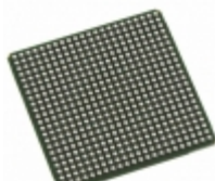
LFE2-50E-5F484I Lattice Semiconductor Corporation IC FPGA 339 I/O 484FBGA