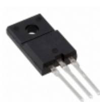
TMA204S-L Sanken Electric Co., Ltd. TRIAC 400V 20A