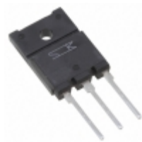
TMA256B-L Sanken Electric Co., Ltd. TRIAC 600V 25A