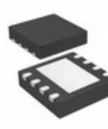
MCP4551T-103E/MF Microchip Technology IC DGTL POT 10K 257TAPS 8-DFN