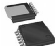
BD4271HFP-CTR LAPIS Semiconductor IC REG LINEAR 4.9V 550MA HRP7