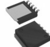
BD42530FP2-CE2 LAPIS Semiconductor IC REG LIN POS ADJ 250MA TO263-5