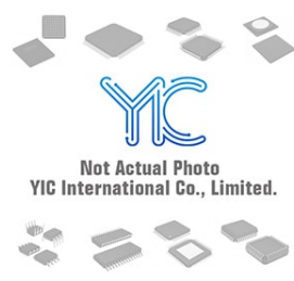
BD4288FVM-FTR ROHM ROHM SSOP-8