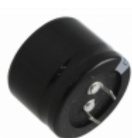
ECO-S1JA332EA Panasonic Electronic Components CAP ALUM 3300UF 20% 63V SNAP