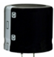
ECO-S1JA472EA Panasonic Electronic Components CAP ALUM 4700UF 20% 63V SNAP