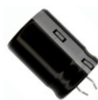
ECO-S1JA681BA Panasonic Electronic Components CAP ALUM 680UF 20% 63V SNAP