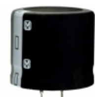
ECO-S1JA392EA Panasonic Electronic Components CAP ALUM 3900UF 20% 63V SNAP