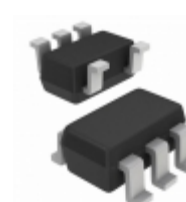
ISL88012IH523Z-T7A Intersil IC VOLTAGE MONITOR DUAL SOT23-5