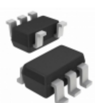
ISL88012IH526Z-T7A Intersil IC VOLTAGE MONITOR DUAL SOT23-5