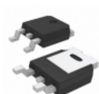
LF50ABDT-TRY STMicroelectronics IC REG LDO 5V 0.5A DPAK