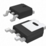
LF50CDT-TR STMicroelectronics IC REG LDO 5V 0.5A DPAK