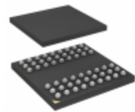
IS42S16400F-6BLI-TR ISSI, Integrated Silicon Solution Inc IC SDRAM 64MBIT 166MHZ 54TFBGA