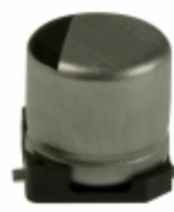
ECE-V0GA101SR Panasonic Electronic Components CAP ALUM 100UF 20% 4V SMD