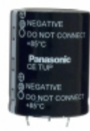
ECE-T2WP681FA Panasonic Electronic Components CAP ALUM 680UF 20% 450V SNAP