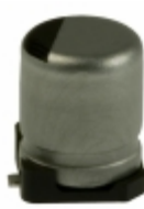
ECE-V0GA221SP Panasonic Electronic Components CAP ALUM 220UF 20% 4V SMD