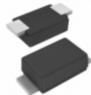
SE20FD-M3/I Vishay Semiconductor Diodes Division DIODE GEN PURP 200V 1.7A DO219AB