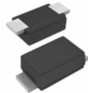
SE20FD-M3/I Electro-Films (EFI) / Vishay DIODE GEN PURP 200V 1.7A DO219AB