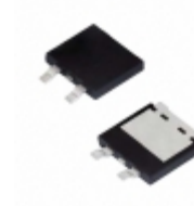
SE20DJHM3/I Electro-Films (EFI) / Vishay DIODE GEN PURP 600V 3.9A TO263AC