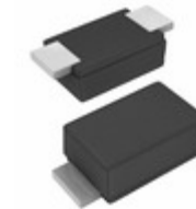
SE20FD-M3/H Electro-Films (EFI) / Vishay DIODE GEN PURP 200V 1.7A DO219AB