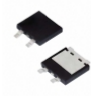
SE20DJ-M3/I Electro-Films (EFI) / Vishay DIODE GEN PURP 600V 3.9A TO263AC