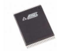
AT27BV4096-15VI Microchip Technology IC OTP 4MBIT 150NS 40VSOP