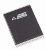
AT27BV4096-15VC Microchip Technology IC OTP 4MBIT 150NS 40VSOP