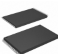
SST39VF3202-70-4I-EKE Microchip Technology IC FLASH 32MBIT 70NS 48TSOP