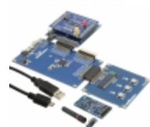
ATA8510-EK1 Microchip Technology EVAL KIT FOR ATA8510/ATA8515