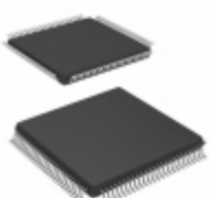
ATF1504ASVL-20AI100 Microchip Technology IC CPLD 64MC 20NS 100TQFP