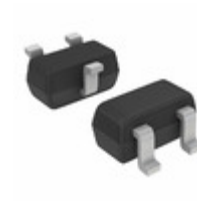
DAP222T1 ON Semiconductor DIODE ARRAY GP 80V 100MA SC75