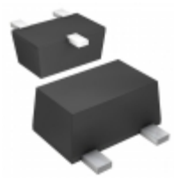
DAP222WMFHTL LAPIS Semiconductor SWITCHING DIODES (CORRESPONDS TO